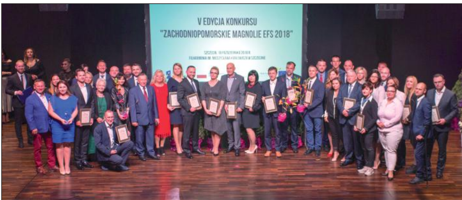
Wszyscy uczestnicy Gali Finałowej.