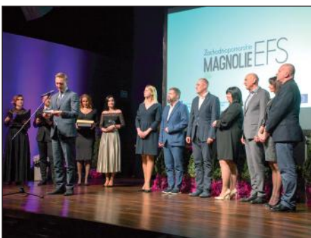
Nominowani „Beneficjenci z pasją”.

3. Regionalny Program Operacyjny Województwa Zachodniopomorskiego: „Najlepszy Beneficjent RPO WL”, „Inwestycje w kadry” oraz „Inwestycje w edukację”.